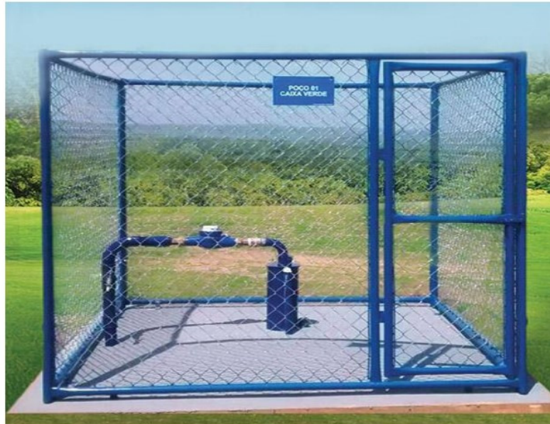
FOTO 2. Modelo de grade de proteção para poço artesiano.

revestimento com 1,0 m 2 x 0,15m de altura, além da colocação de um tampão metálico resistente e difícil remoção para evitar a ação de possíveis vândalos.