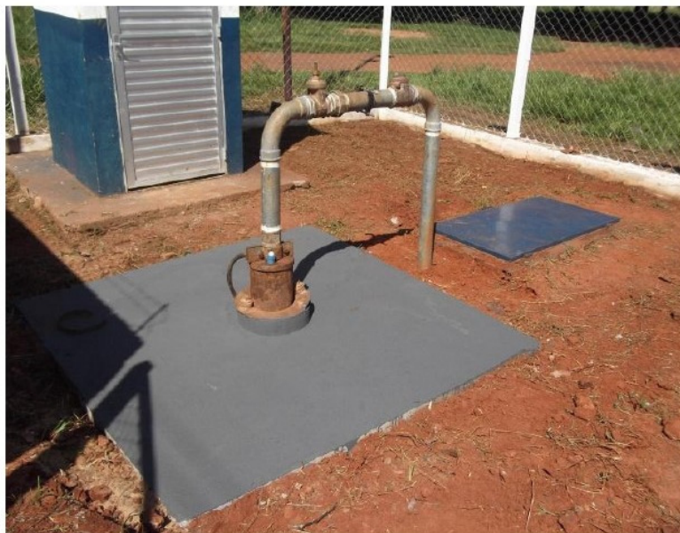
FOTO 3. Laje de proteção para poço artesiano.